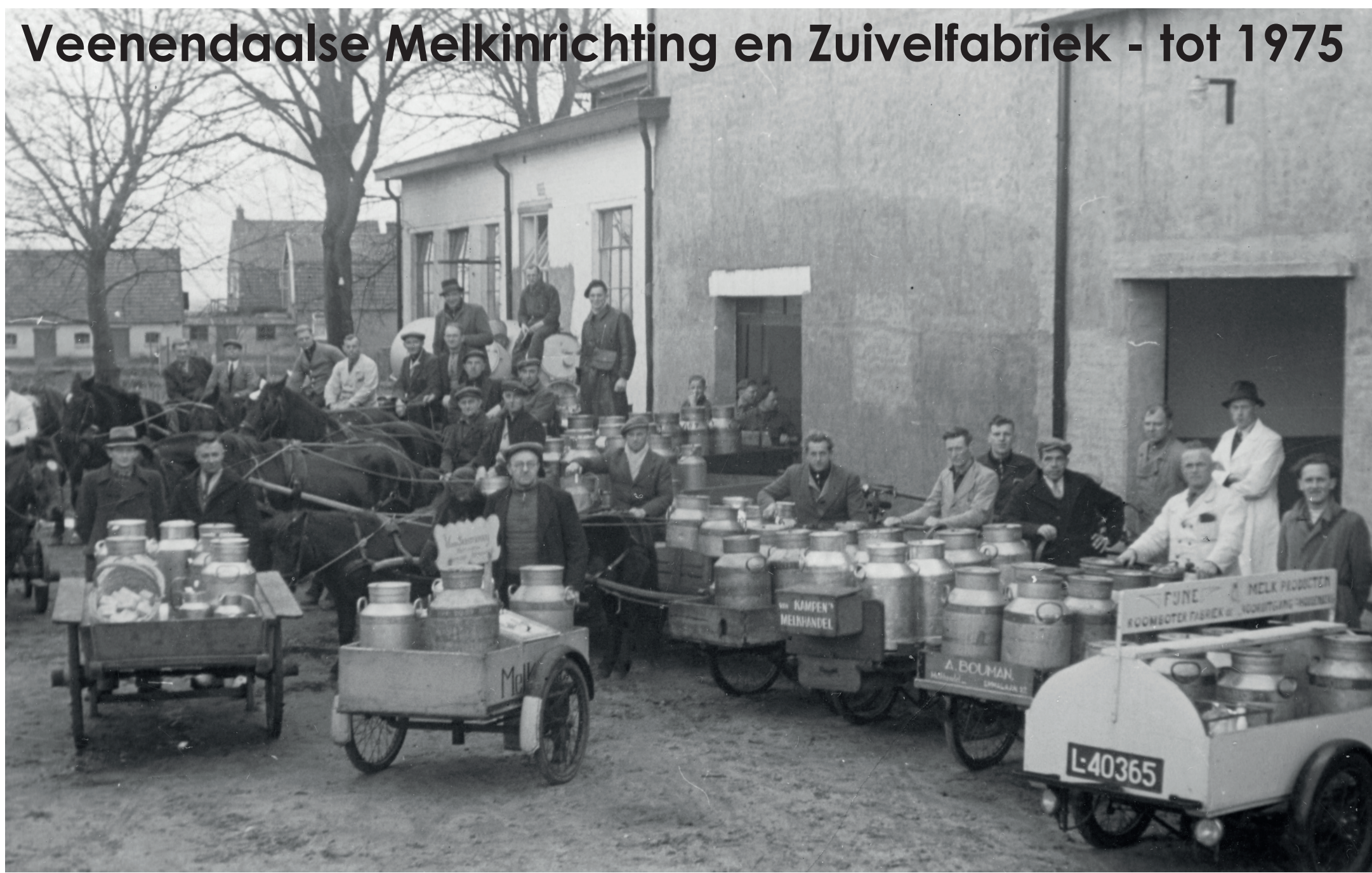
Veenendaalse Melkinrichting en Zuivelfabriek - tot 1975